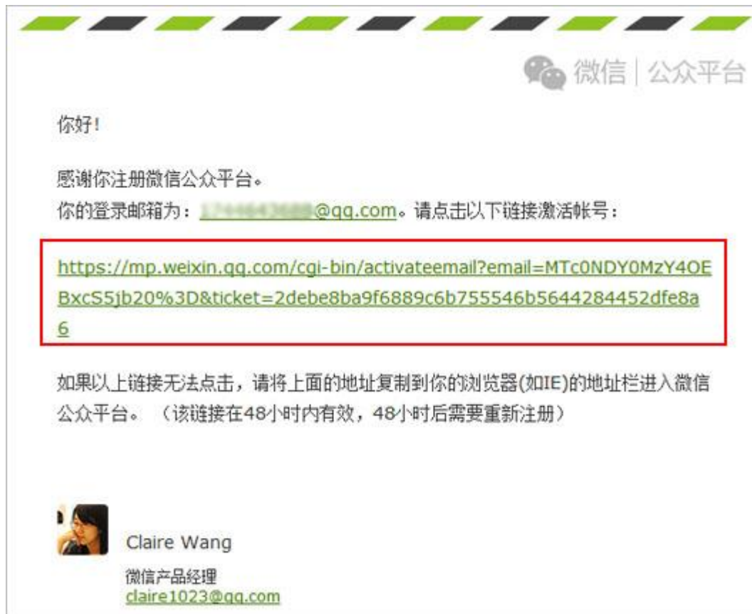
图表 4 账号激活邮件