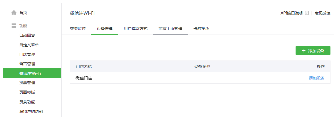
图表 9 微信设备管理页面