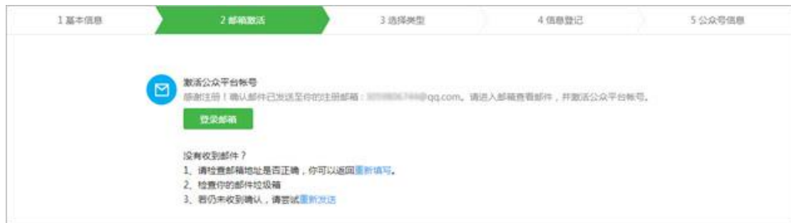
图表 3 账号激活页面