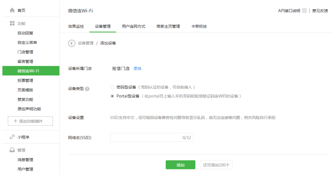
图表 10 微信设备添加界面

保存设置后将会出现微信商店信息，其中下图中的红框部分将会在 GWN 产品 portal 设置中用到。