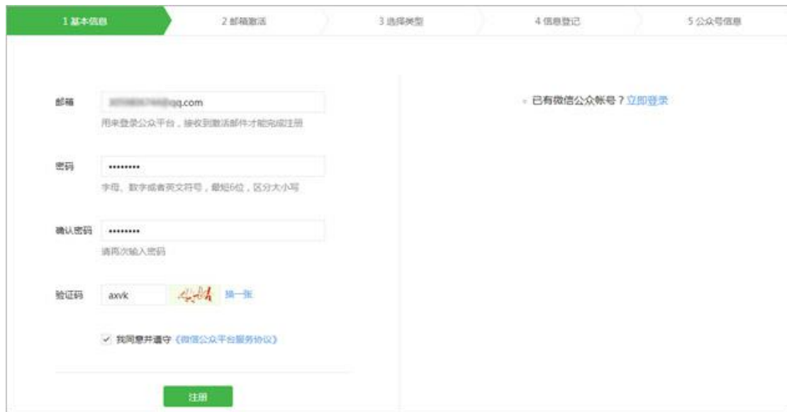
图表 2 填写公众号注册信息