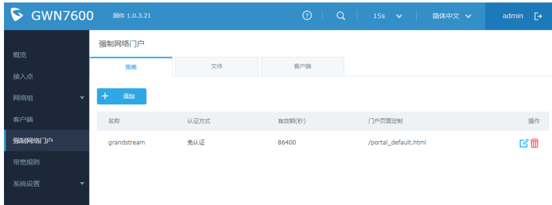
图表 13 captive policy 配置页面