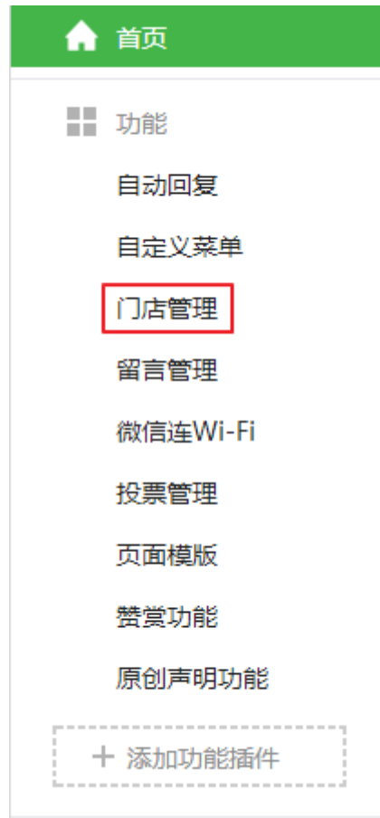
图表 6 公众号后台导航栏 a