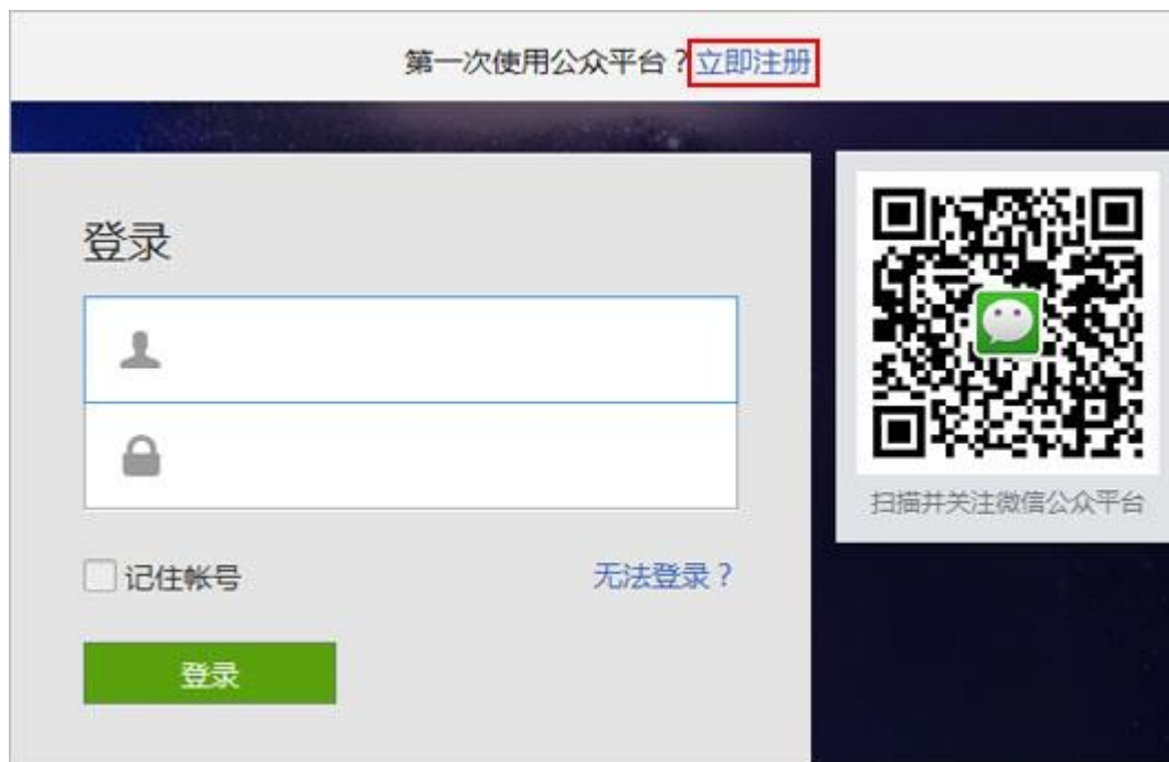
图表 1 微信公众平台登录页面