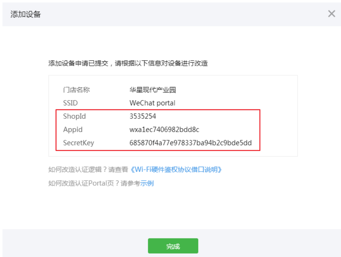
图表 11 微信商店公众号信息

保存设置后将会出现微信商店信息，其中下图中的红框部分将会在 GWN 产品 portal 设置中用到。