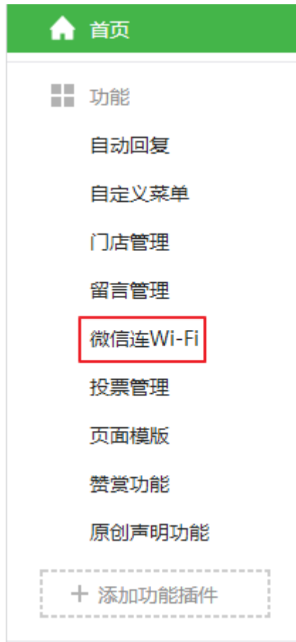
图表 8 公众号后台导航栏 b