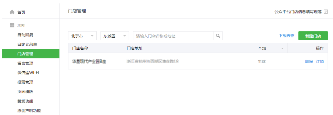
图表 7 公众号后台设备管理页面